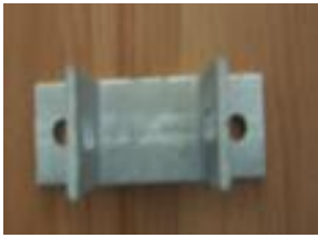
Vägg/golvfäste 40 mm plast, 50mm trä