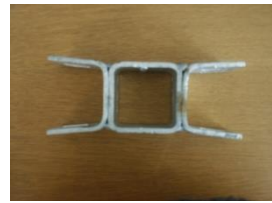
Skarvbygel, förlängd vägg