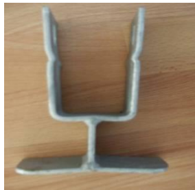
Dörrstyrning där dörrar möts, höger-vänsterfront.