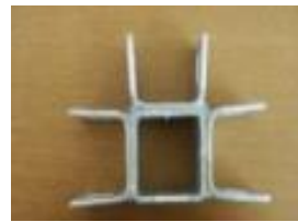
Stolpkoppling front- mellanvägg-front.