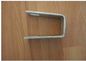
Klämbygel frontstolpe- frontvägg