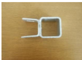
Envägs bygel till front stolpe -mellanvägg