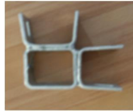
Stolpkoppling front . mellanvägg