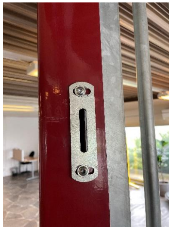
Låsbricka, en mindre till överdelen och en större till nederdelen.