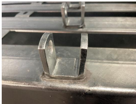
Gångjärnsfäste svetsat på stolpe