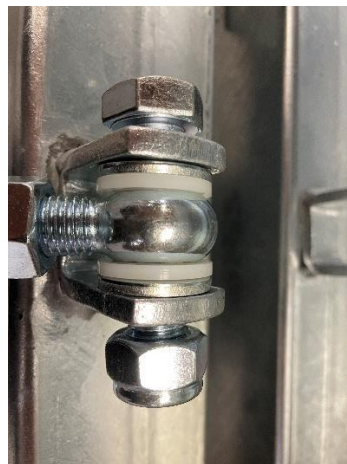
Gångjärn monterat i gångjärnsfäste.