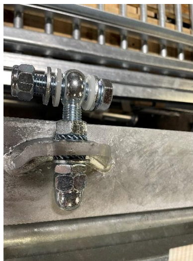
Gångjärn monterat på dörr.