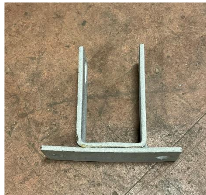
Fäste till takås