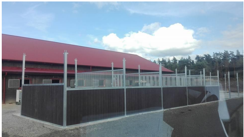
Plank nedtill, h-profiler och galler är på plats.

Man får snedskära bräderna på gavlarnas yttersidor, för att få rätt lutning på taket. Lägg övre u-profilen mellan stolparna och dra en linje på bräderna som mall att såga efter. Sätt sedan på U-profilerna och spänn dessa i fästet med vagnsbult.